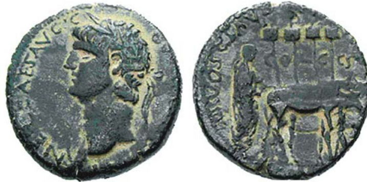
Fig. 2 – Acco-Ptolemaida bajo Nerón. Fecha: 54 – 68 d.C. Metal: bronce. Anverso : Busto laureado de Nerón, mirando hacia la izquierda. Reverso : Ceremonia de fundación de la colonia : el emperador como fundador arando con dos bueyes. En la parte superior del campo, cuatro vexilla que representan las cuatro legiones romanas estacionadas en la ciudad: III, VI, X e XII (MESHORER 1985, 12, fig. 2).

La moneda de la fig. 2 muestra ese esquema iconográfico. Se trata de una moneda emitida en la ciudad de Acco-Ptolemaida, durante el primer siglo d.C., acuñada por las autoridades locales de la ciudad de Acco durante el gobierno del Emperador Nerón. La representación de Nerón en el acto de la fundación de la ciudad está directamente relacionada a la elevación del estatuto de la ciudad a colonia romana 11 . A partir de ese momento, la ciudad pasó a ser denominada Colonia Ptolemaida.