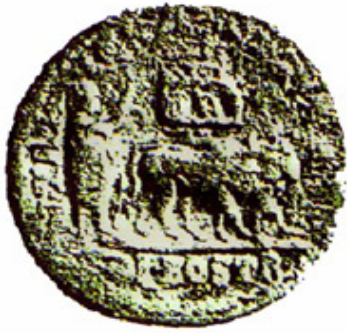
Fig. 11 – Bostra bajo Severo Alexandre. Fecha: 222-235 d.C. Reverso: Ceremonia de fundación de la colonia: el emperador como fundador arando con dos bueyes. En la parte superior del campo, altar del diós nabateu Dusares (MESHORER 1985, p. 88 fig. 241).

La presencia de un altar de Dusares en esa moneda evidencia una línea muy tenue entre la estrategia político-ideológica de los romanos y la “resistencia” de las poblaciones locales 15 . A un lado, esto forma parte de una estrategia romana que tiene por objeto mostrar un enlace de Roma con la población local, lo que sugiere una complicidad religiosa entre Roma y las ciudades dominadas: un rito de fundación romano, en esencia, observado y aceptado por el dios más importante de la ciudad, Dusares. Esta complicidad religiosa era pretendida por los romanos para mostrar su posición de señores de las provincias, pero señores justos.