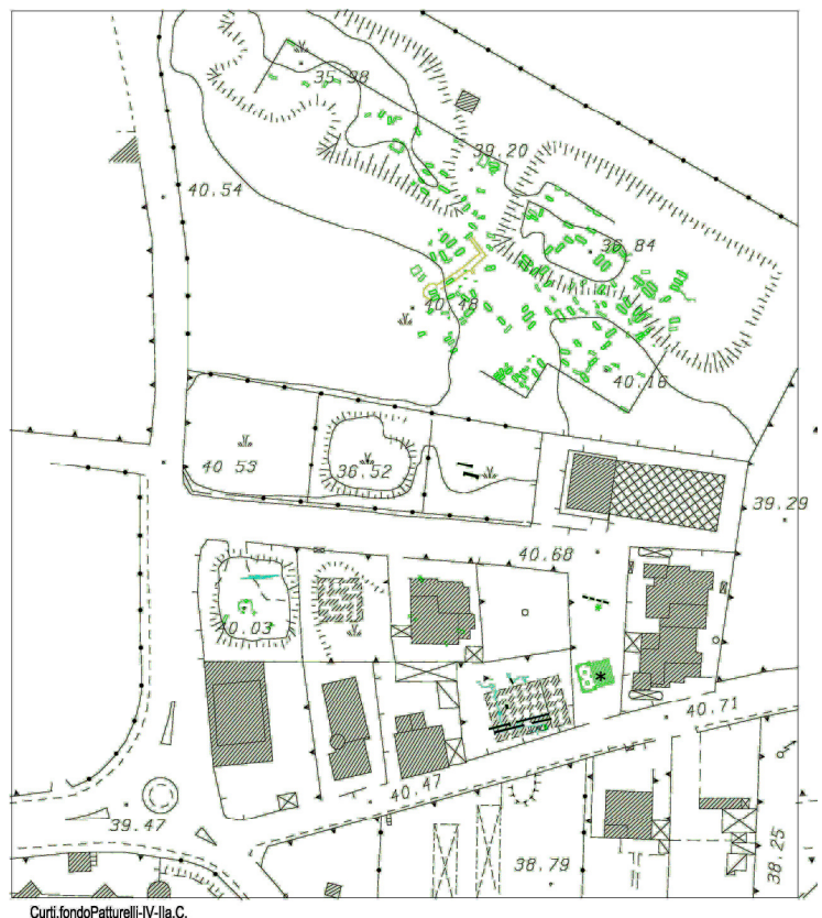
Fig.2 – Planimetria dell'area del santuario tra VII e IV secolo a.C. (R. Donnarumma, SANC).

Ignoriamo l'estensione del santuario tra la metà del VI e gli inizi del V sec. a. C., periodo in cui la sua importanza è però documentata dal cospicuo numero di terrecotte votive che per varietà di tipi e dimensioni risultano essere state pertinenti a più edifici di uso diverso (da quello prettamente sacro, al piccolo donario, all'edicola, agli apprestamenti per gli addetti al culto, ad ambienti di servizio), da alcune sculture in tufo, da frammenti di statue fittili e dai frammenti di ceramica di impasto e di bucchero; dai resti di un capitello ionico e di una tavola per offerte entrambi in tufo, dalla strada orientata est ovest scoperta in questo 2008 e dai resti di piccoli edifici individuati più a nord, dei quali però non è possibile definire la funzione. Dalle indagini sino ad ora condotte risulta che in tale periodo l'area non è mai utilizzata per sepolture.