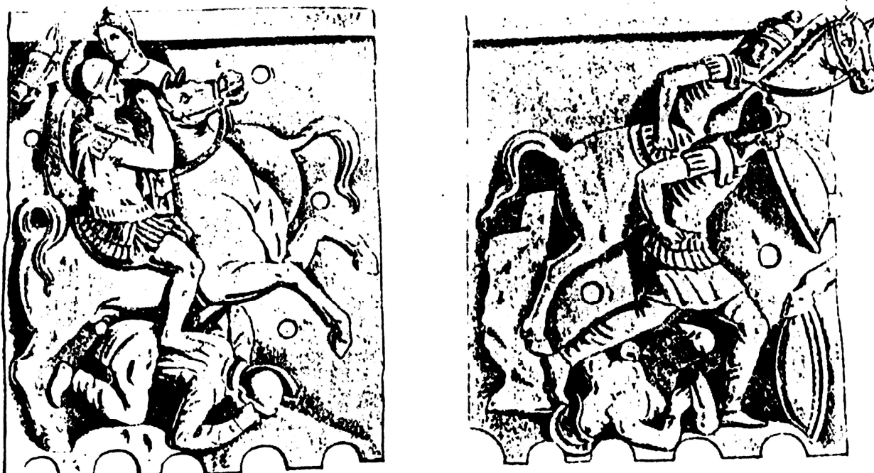
Fig. 8 . Cales . Verkleidungsplatten con scene di battaglia tra Romani e Orientali+ (da KOCH 1912, 99, Abb. 128).

Non abbiamo elementi sufficienti per ipotizzare sulla trabeazione o architrave di quale edificio potesse esser inchiodato questo fregio fittile, tanto più che delle lastre neppure si conoscono le dimensioni 50 : il vecchio disegno a tratto, in apparenza veristico, con bassorilievo e sottosquadri pronunciati, lascia intendere una discreta manifattura, ma - stando a quanto riferisce il Riccio 51 - non priva di pecche, se è vero che i profili verticali di congiunzione tra le tre Verkleidungsplatten giustapponevano i singoli pinakes fittili senza curarsi che l'immagine cadesse a cavaliere fra due placche distinte.