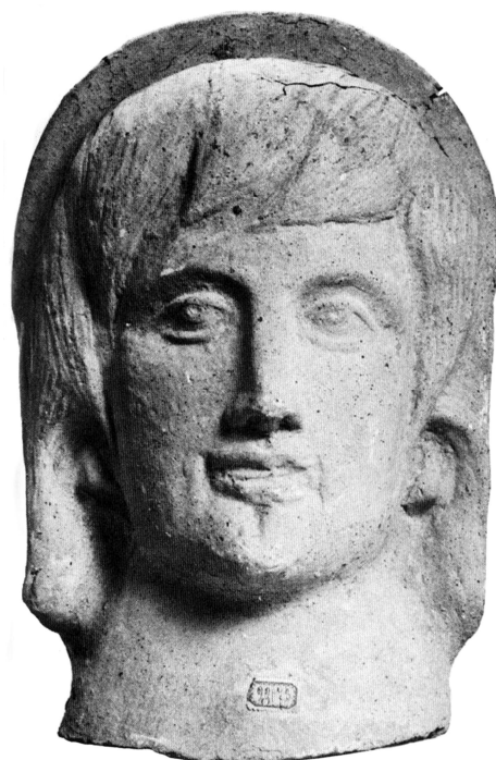
Fig. 7 . Cales. Testa femminile velata (da BONGHI JOVINO 1990, 81, tav. IV).

La sovrapposizione di queste nuove tendenze si apprezza in Campania a macchia d'olio, se persino ad Avella la coroplastica votiva illustra un ventaglio tipologico da parte delle committenze che include, tra gli altri, grandi statue a modulo naturale maschili e femminili e teste velate dalle quali non solo traspare il solido collegamento con la tradizione figurativa tradizionalmente definita %medio-italica+, ma nella fattispecie con la grande plastica calena nel suo ormai acquisito statuto di colonia latina.