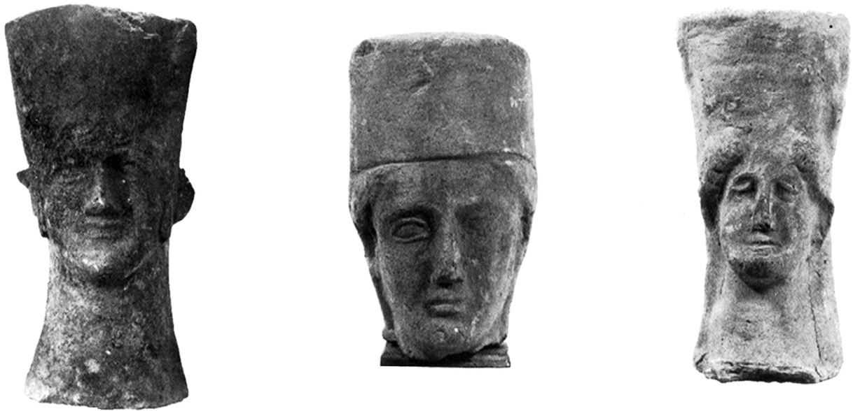
Fig. 5. Cales . Teste femminili con polos (da CIAGHI 1993, 45, figg. 17-19).

gnogrecizzanti e sicelioti non vi sembrano sempre saldamente sedimentati 34 , se ci fondiamo - ad esempio - sulla modesta rappresentanza di volti femminili con polos, noti, invece, dai santuari capuani 35 (fig. 5).