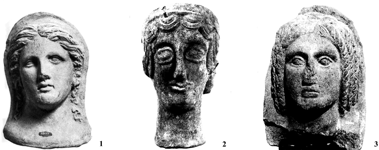
Fig. 6 . Cales. 1. Testa femminile velata 2. Testa femminile con acconciatura a festone 3. Testa femminile velata con acconciatura a %boccoli libici+(da CIAGHI 1993, 67, fig. 30; 51, fig. 23; 55, fig. 25).

Uno spiraglio eloquente, nella coroplastica votiva, dell'espansione politica di Roma nell'attardato IV secolo sino al III a.C. in Campania può senz'altro cogliersi nel nutrito drappello delle teste velate di offerenti 41 , che indicano la partecipazione di Cales a una koinè etrusco-meridionale e laziale (figg. 6.3; 7); in esse sarebbe da vedere il corrispettivo iconografico dell'assunzione di una prassi culturale more Romano 42 . L'adozione di modelli comportamentali in ambito religioso nelle colonie latine, in generale, indicherebbe l'adesione al sacrificio, o più modestamente, a manifestazioni devozionali da parte degli offerenti che richiedevano per tradizione la velatio capitis 43 .