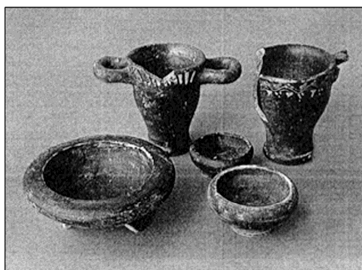
Fig. 4 . Cales . Materiali votivi dall'area sacra di Ponte delle Monache (da PASSARO 1993a, 57, figg. 48-50).

Marica presso Minturnae 30 - statuine rudemente plasmate, aera rudia - il quale sembra, al momento, risolversi nella fase ausone (VII-VI sec. a.C.).