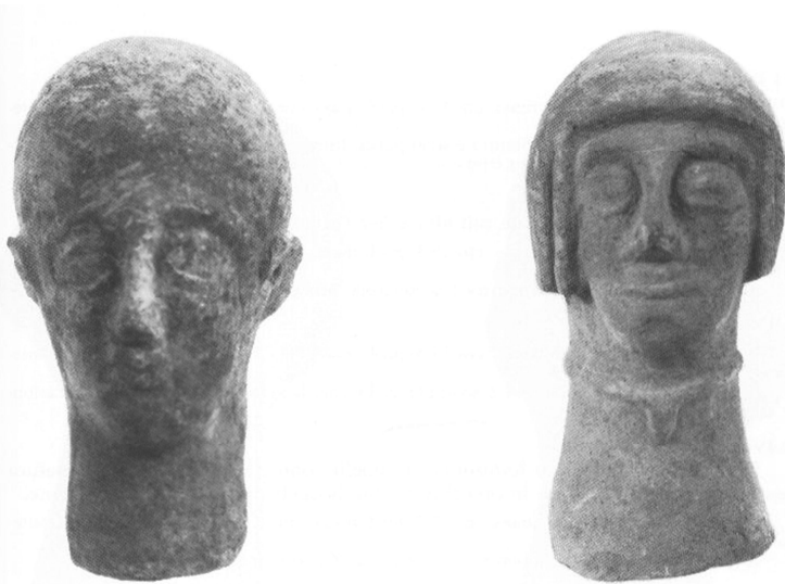
Fig. 3. Cales . Teste maschili con acconciatura a calotta (da CIAGHI 1993, 111, figg. 72-73).

ria della partecipazione al culto, l'adozione dei diversi linguaggi, le componenti etniche presenti in un centro 23 .