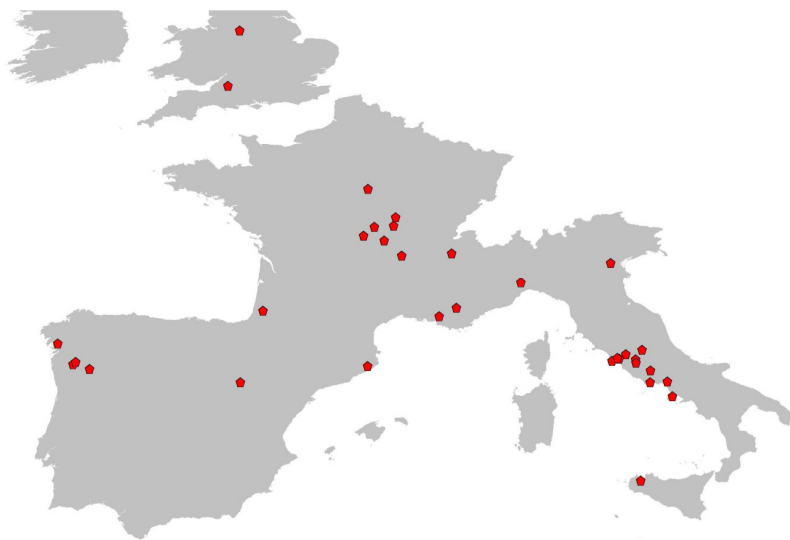
Fig. 3 - Localización de los principales enclaves AQUAE identificados en las fuentes clásicas dentro del territorio objeto de nuestro estudio.

- Tipo 2. Se constatan otra serie de edificios situados en un ámbito más urbano o desarrollado, que presentan estructuras complejas y de dimensiones mayores, en los que prima la monumentalización y la presencia de gran número de salas para distintos tratamientos y usos. En la mayoría de estos edificios, al menos hasta mediados del s. II d.C. no se desarrollarán instalaciones de calefacción (caso de hipocausta ), ya que primaría la explotación de los manantiales más calientes, cuyo potencial calorífico evitase la creación de infraestructuras complejas y costosas 16 , como sí sucedía en el caso de los balnea o thermae . Ejemplos de las primeras fases de edificios como Bath (Inglaterra) 17 , Aix-les-Bains (Francia) 18 , Civitavecchia (Italia) 19 . Ourense (España) 20 , podrían mostrar esa caracterización.