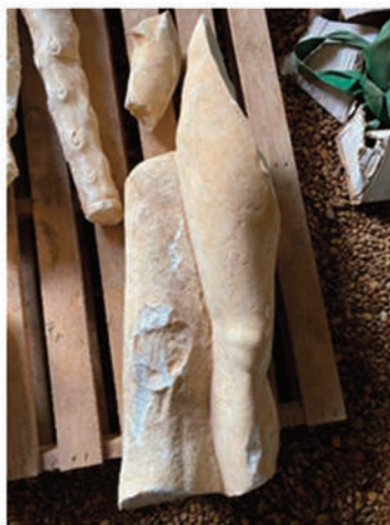
GAMBA DESTRA E MASSO ROCCIOSO (alt. 98 cm; alt. roccia 70 cm; spess. 20-35 cm; largh. 38 cm; interfaccia rottura recente ca. 43 cm; peso 90,30 kg)