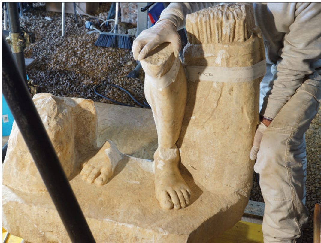
7. STATUA DI ERCOLE, PRESENTAZIONE DEI FRAMMENTI A SECCO PER LO STUDIO DEGLI IMPERNIAGGI