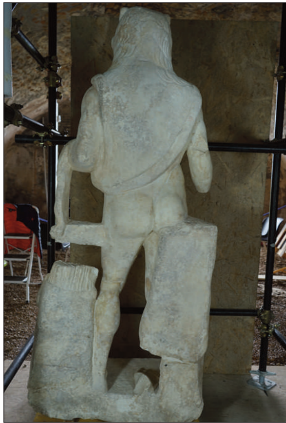
14. STATUA DI ERCOLE, RETRO DELLA SCULTURA AL TERMINE DEL RESTAURO (foto L. Loi)

Si è scelto infine di non applicare uno strato protettivo, sia in considerazione del fatto che l'opera sarà esposta solamente in ambienti chiusi e climatizzati, sia perché la pulitura eseguita ha mantenuto un livello tale da conservare sulle superfici un leggero strato carbonatico formatosi lentamente nel tempo a seguito del reinterro (figg. 13-14).