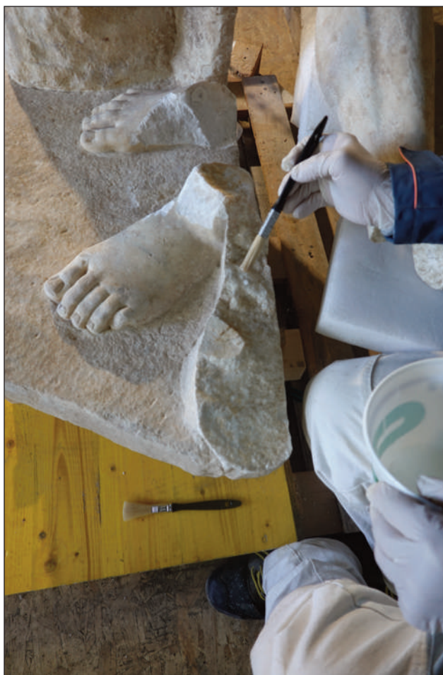
6. STATUA DI ERCOLE, APPLICAZIONE DELLO STRATO DI SACRIFICIO SULLE SUPERFICI DI FRATTURA