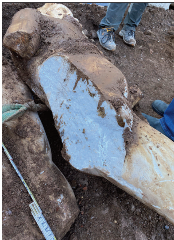
3. STATUA DI ERCOLE, FRATTURA CAUSATA DAL MEZZO MECCANICO AL MOMENTO DELLO SCAVO