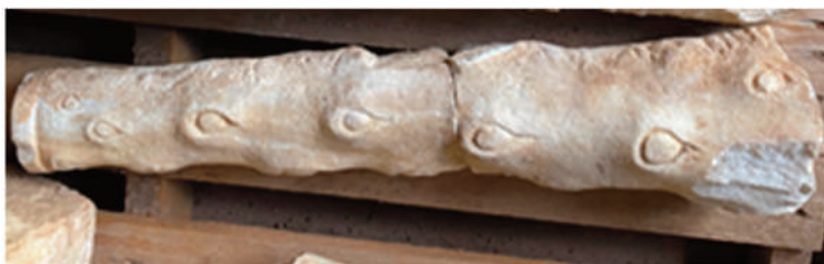
CLAVA (composta da 2 frammenti; alt. 65 cm; largh. max 16-10 cm; spessore max 10-16 cm; peso 11,79 kg)