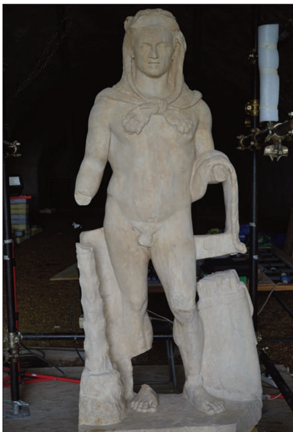
13. STATUA DI ERCOLE, FRONTE DELLA SCULTURA AL TERMINE DEL RESTAURO