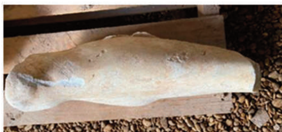
POLPACCIO E GINOCCHIO SINISTRO (alt. 45 cm; spess. 6 cm; peso 13,12 kg)