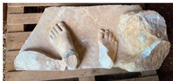
BASAMENTO CON PIEDI E BASE DEL MASSO ROCCIOSO (alt. 50 cm - dx), 15 cm - sx; lungh. max 90 cm; largh. max 45 cm; peso 178 kg)