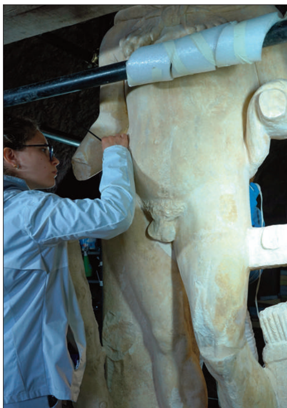
12. STATUA DI ERCOLE, EQUILBRATURA CROMATICA AD ACQUERELLO