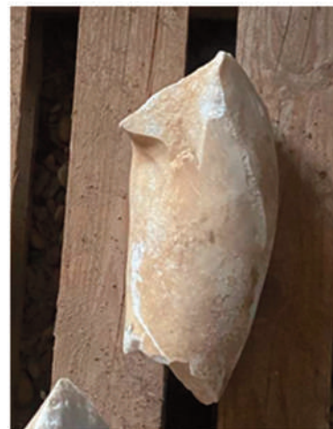
AVAMBRACCIO DESTRO (alt. 25 cm; spess. 7-10 cm; peso 4,54 kg)