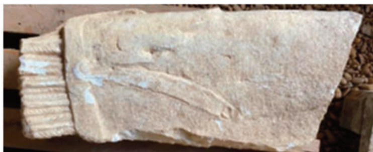
FARETRA (alt. 90 cm; spess. 10 cm; largh. 27 cm; peso 39,80 kg)