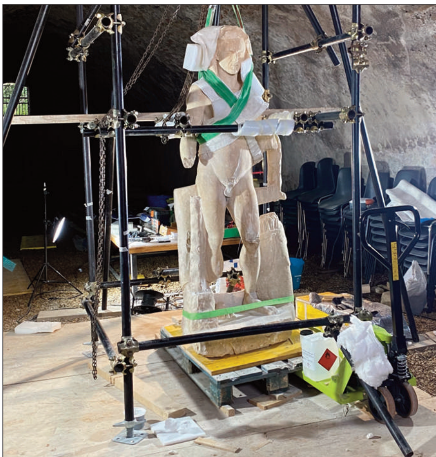
9. STATUA DI ERCOLE, POSIZIONAMENTO DELLA PORZIONE SUPERIORE AL BASAMENTO

Solo in poche porzioni si sono fatti impacchi o con soluzione di sali inorganici o solo con soluzioni sature di carbonato di Ammonio, per equilibrare cromaticamente o ammorbidire le concrezioni e poterle rimuovere meccanicamente a bisturi e/o con specilli vari.