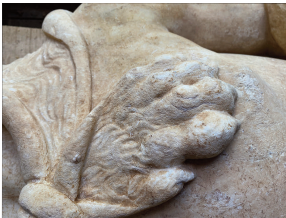
5. STATUA DI ERCOLE, ABRASIONE E PERDITA DI COESIONE DEL MARMO, DETTAGLIO DELLA ZAMPA

Costruite le copie digitali dei singoli frammenti è stato possibile realizzare una ricostruzione digitale della statua oggetto di analisi con l'utilizzo di software dedicati 1 ; - indagini scientifiche , i cui obiettivi principali erano quello di identificare il litotipo e, quindi, definirne la provenienza comparando i risultati ottenuti con quelli che caratterizzano i più importanti marmi bianchi impiegati in antico; classificare le forme di alterazione macroscopiche.