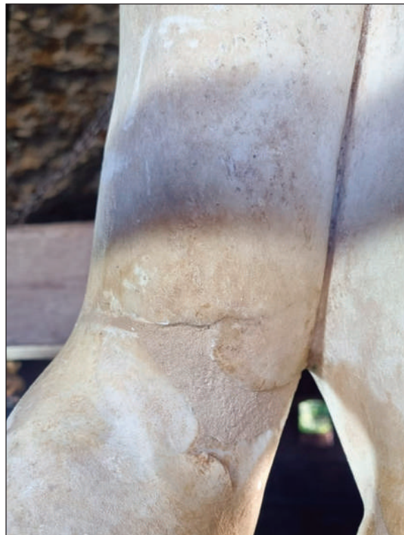
11. STATUA DI ERCOLE, PARTICOLARE DELLA STUCCATURA SUL BRACCIO DESTRO