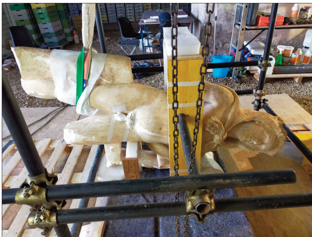
8. STATUA DI ERCOLE, INCOLLAGGIO DELLA GAMBA DESTRA AL BUSTO