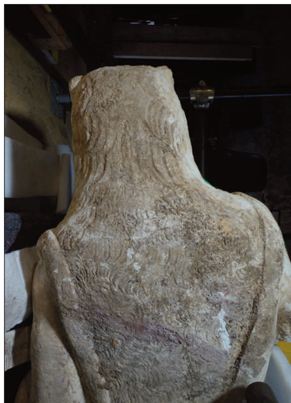
4. STATUA DI ERCOLE, DEPOSITI E INCROSTAZIONI SUL RETRO DELLA STATUA, DETTAGLIO

Al centro del ventre era evidente un profondo graffio nonché una mancanza in corrispondenza dei genitali, attribuibili inevitabilmente, come già detto, all'azione del mezzo meccanico escavatore.