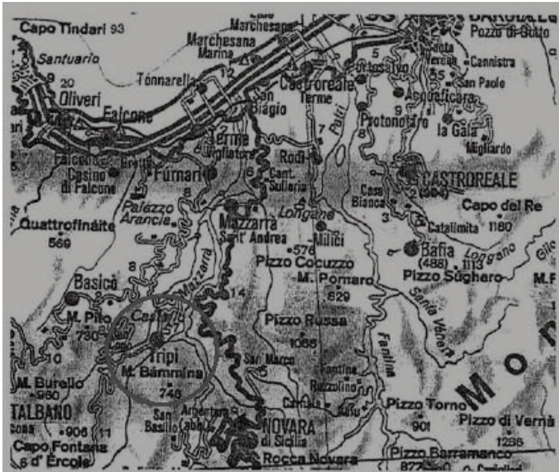
1. TRIPI (ME). ELABORAZIONE GRAFICA DI G. SOFIA

Della città di Abakainon , antico centro indigeno grecizzato e poi romanizzato, conosciamo soltanto l'ubicazione e quanto tramandato dalle fonti storico-letterarie. Il tessuto urbano vero e proprio si dovette sviluppare a nord dell'altura oggi dominata dal "Castello", nell'attuale frazione Casale, su una vasta area pianeggiante denominata "Il Piano". Le evidenze archeologiche, benché molto limitate, si riferiscono ad una imponente struttura muraria costituita da filari isodomi di blocchi, da interpretare come probabile sistemazione monumentale di un terrazzamento a monte di un'agorà, nonché a tracce di un quartiere di abitazione risalente al III secolo a.C.