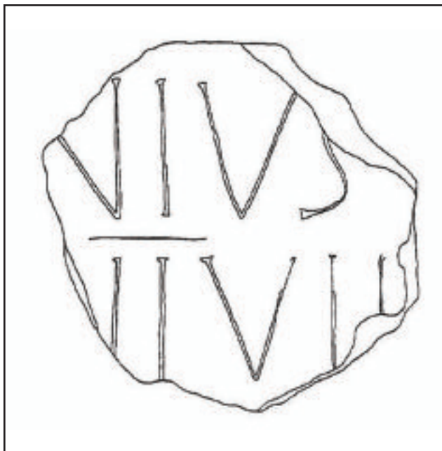
3. FRAMMENTO DI LASTRA MARMOREA ISCRITTA (da COPPOLINO-SOFIA 2015A, 31, fig. 6)

Un frammento di lastra marmorea iscritta proviene dal centro della contrada “Il Piano”: 15 l’iscrizione latina è databile tra il I ed il II secolo d.C. (fig. 3) e, benchè estremamente frammentaria, riveste notevole importanza dal momento che si tratta di un documento pubblico nel quale viene sicuramente menzionato un personaggio che ha rivestito la carica di duoviro . Il frammento, rinvenuto nel 1952 dal Villard, recante la titolatura di un purtroppo anonimo duovir , piuttosto che indicare una consistenza amministrativa di Abacaenum , non altrimenti documentata per l’epoca imperiale, potrebbe invece riferirsi ad uno dei magistrati della vicina colonia di Tindari ed attestare la dipendenza amministrativa di Abacaenum , città peraltro non ricordata da Plinio nel celebre elenco delle comunità stipendiarie. 16