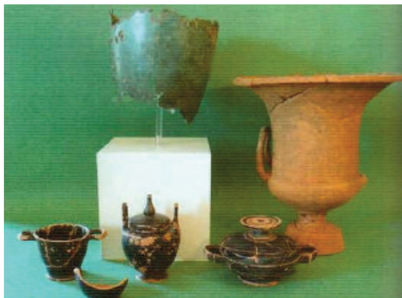
7. TRIPI (ME). MUSEO ARCHEOLOGICO “SANTI FURNARI”. CORREDO FUNERARIO PROVENIENTE DALLA NECROPOLI CONTRADA CARDUSA