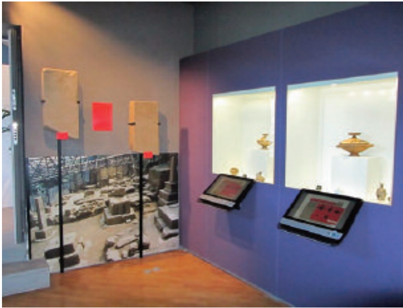
12. TRIPI (ME). MUSEO ARCHEOLOGICO “SANTI FURNARI”. PIANO TERRA. SALA ESPOSITIVA

Ospita il Museo lo “storico” Palazzo Santi Furnari, generoso lascito della famiglia alla cittadinanza, recuperato da un sapiente restauro architettonico-conservativo e funzionalizzato a vero e proprio polo culturale, vitale e dinamico di attività plurivalenti. Al primo e al secondo livello dell’edificio (figg. 12-13), la contestualizzazione dei reperti archeologici provenienti dai corredi funerari della necropoli di contrada Cardusa testimonia gli usi e i costumi della città di Abakainon . Al terzo livello, un Centro Multimediale rappresenta l’innovazione introdotta dal progetto tecnico-scientifico di allestimento.