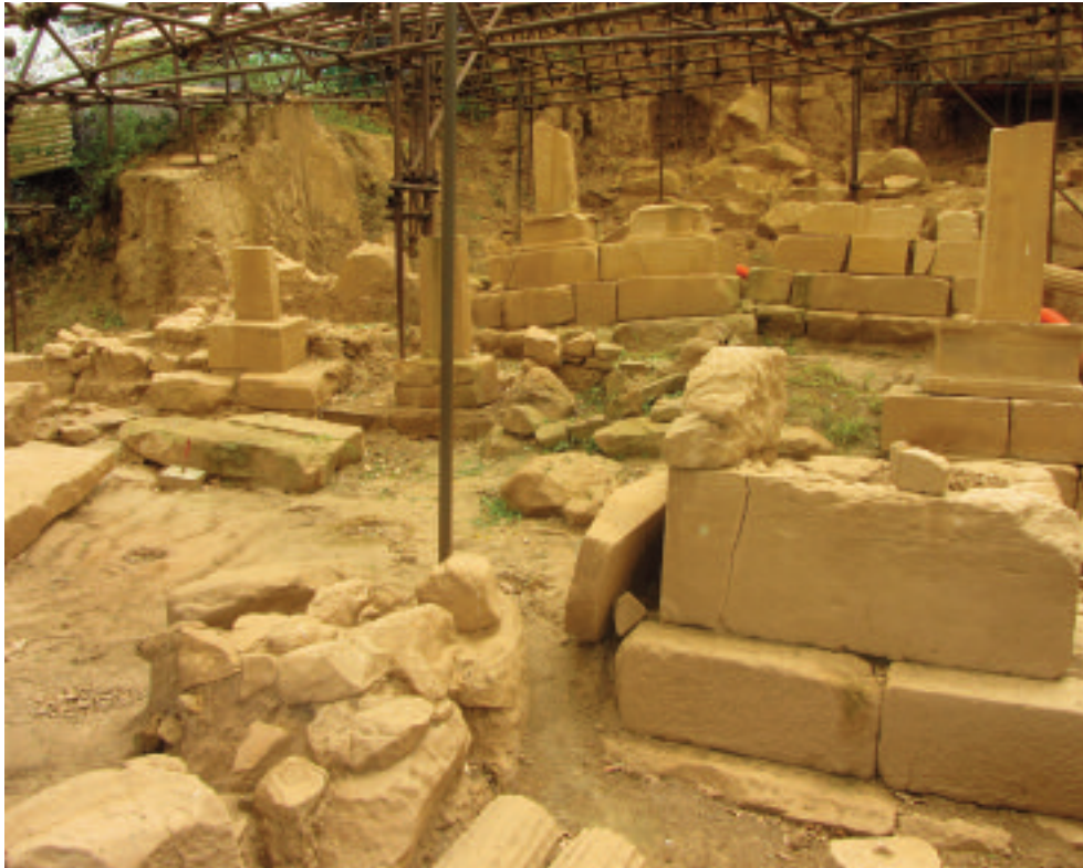
4. ABAKAINON (TRIPÌ). LA NECROPOLI IN CONTRADA CARDUSA: PARTICOLARE DELL'AREA DI SCAVO