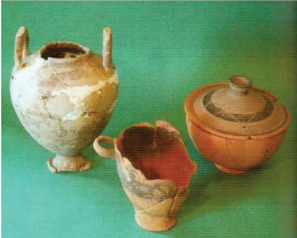
10. TRIPI (ME). MUSEO ARCHEOLOGICO "SANTI FURNARI". CORREDO FUNERARIO PROVENIENTE DALLA NECROPOLI CONTRADA CARDUSA