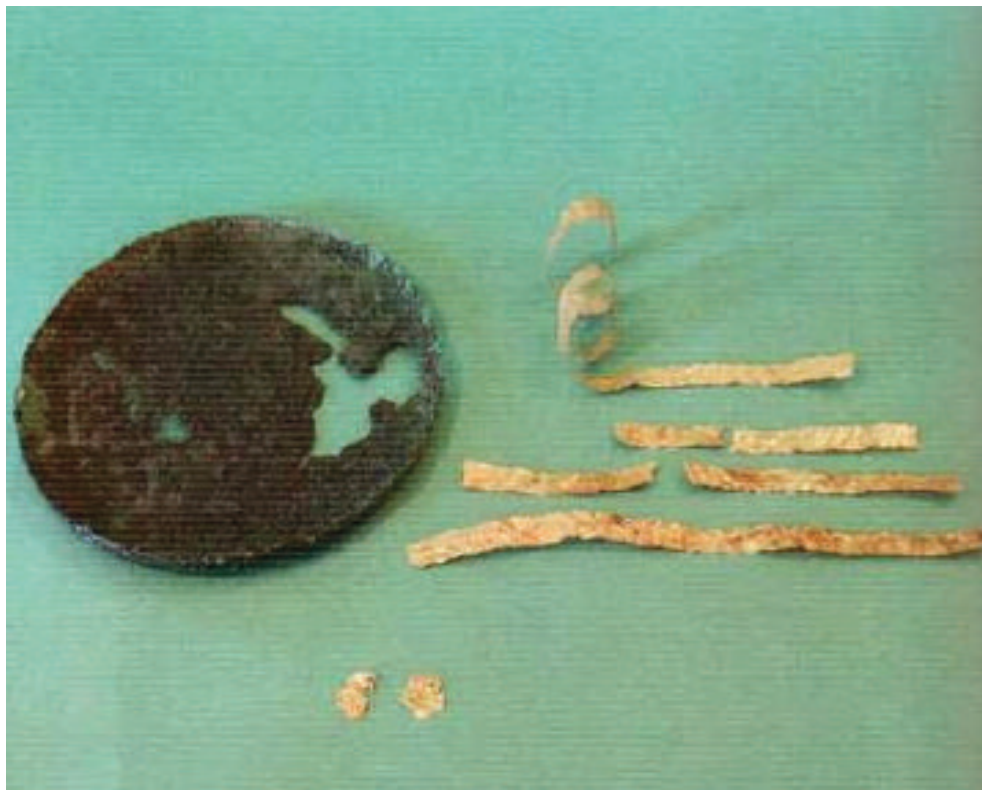
11. TRIPI (ME). MUSEO ARCHEOLOGICO "SANTI FURNARI". CORREDO FUNERARIO PROVENIENTE DALLA NECROPOLI CONTRADA CARDUSA