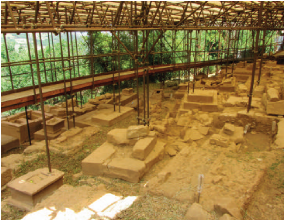
5. ABAKAINON (TRIPÌ). LA NECROPOLI IN CONTRADA CARDUSA: PANORAMICA DELL'AREA DI SCAVO