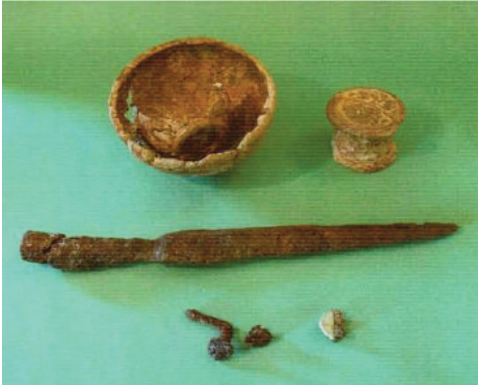
8. TRIPI (ME). MUSEO ARCHEOLOGICO "SANTI FURNARI". CORREDO FUNERARIO PROVENIENTE DALLA NECROPOLI CONTRADA CARDUSA