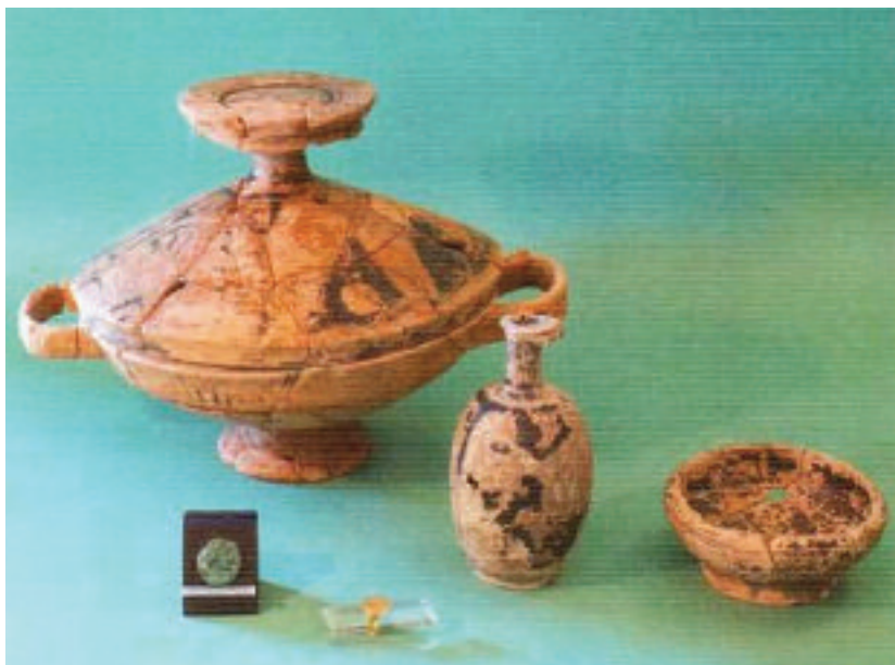
6. TRIPI (ME). MUSEO ARCHEOLOGICO “SANTI FURNARI”. CORREDO FUNERARIO PROVENIENTE DALLA NECROPOLI CONTRADA CARDUSA

I materiali della necropoli 23 sono esposti nel Museo Archeologico “Santi Furnari” di Tripi (figg. 6-11). L’apertura alla fruizione di tale Museo nel gennaio 2012 costituisce un concreto e significativo esempio dei positivi risultati cui può giungere, nell’interesse della collettività, l’impegno sinergico di Amministrazioni istituzionalmente preposte alla fruizione e valorizzazione di Beni paradigmatici della storia di un popolo o di un territorio: il Comune di Tripi, che ha fortemente voluto la sua realizzazione finanziandone il progetto e l’allora Unità Operativa X della Soprintendenza BB.CC.AA. di Messina, congiuntamente al Servizio Parco Archeologico delle Isole Eolie, che hanno curato la parte scientifica e didattica dell’esposizione archeologica, qualificandone le finalità di “conoscenza” e di “memoria”.