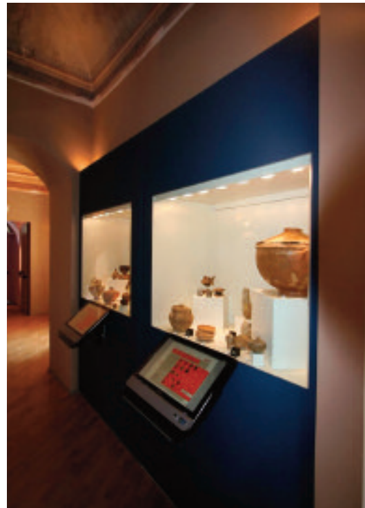
13. TRIPI (ME). MUSEO ARCHEOLOGICO “SANTI FURNARI”. PIANO PRIMO. SALE ESPOSITIVE