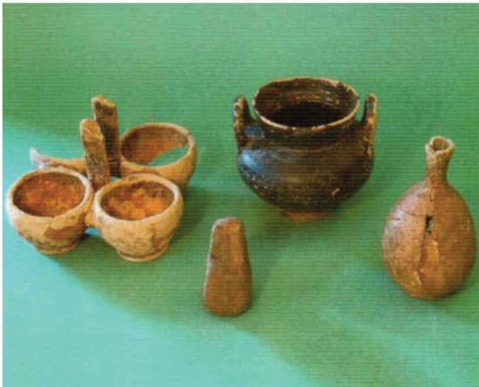
9. TRIPI (ME). MUSEO ARCHEOLOGICO "SANTI FURNARI". CORREDO FUNERARIO PROVENIENTE DALLA NECROPOLI CONTRADA CARDUSA