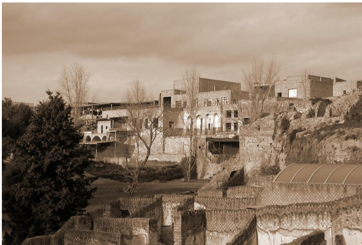
Fig. 1. Pompei, panoramica da ovest dell'Insula Occidentalis.