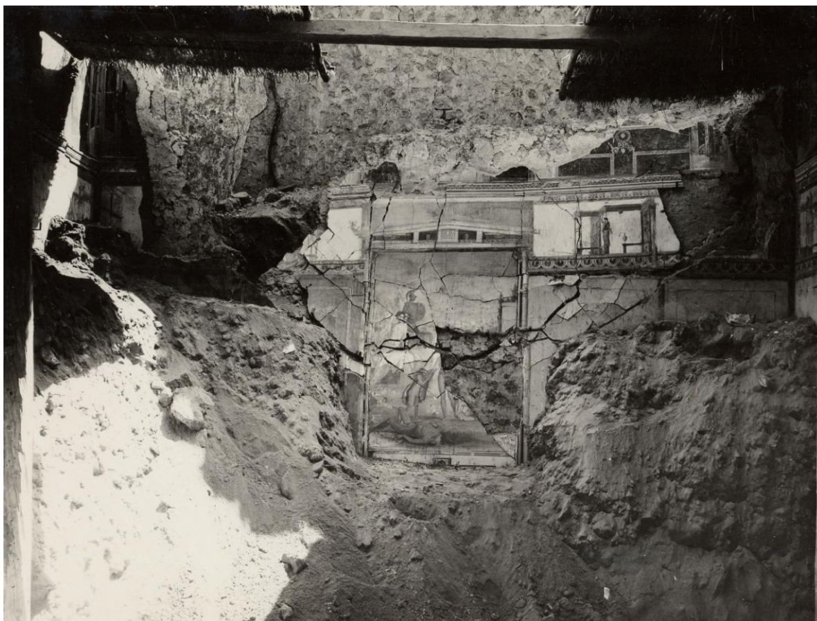
Fig. 4. Pompei Villa Imperiale, oecus "A", parete est.