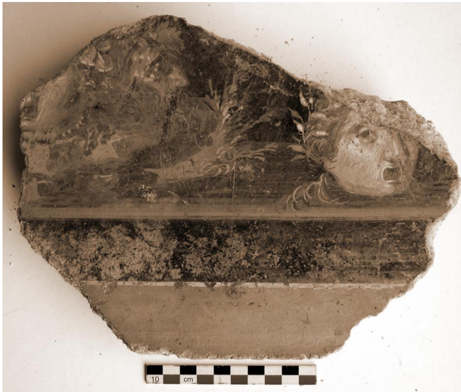
Fig. 6. Pompei villa Imperiale, frammento in IV stile iniziale con pinax con maschere teatrali su fondo azzurro (VIMPY 84, piano superiore, cisterne).