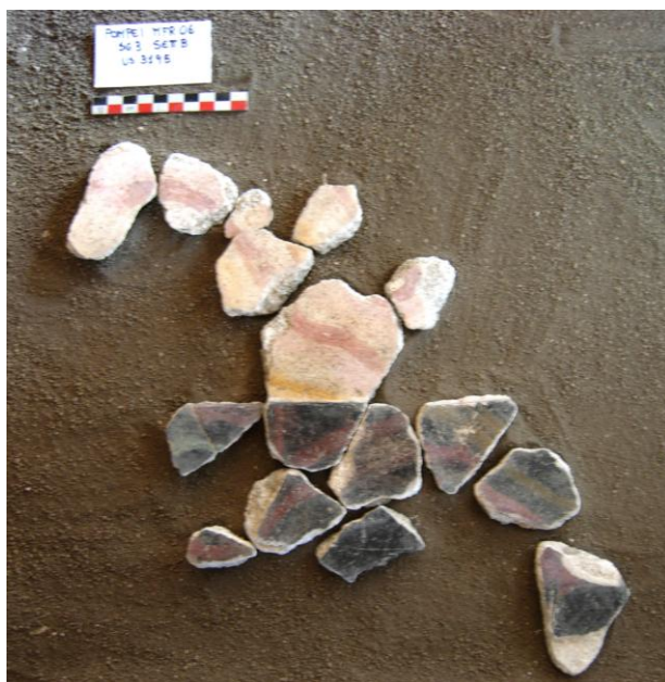
Fig. 3. Pompei Casa di Marco Fabio Rufo, frammenti di I stile (MFR 06, Saggio 3 Sett. B US 3195).

Particolarmente interessante per il prosieguo dei lavori è il rinvenimento anche qui di elementi sporadici in I stile non pertinenti alle scelte decorative della villa, reimpiegati quali materiali di riempimento per l'alloggiamento di grossi tubuli utili al drenaggio dell'acqua dalla terrazza soprastante del complesso. Degno di nota è il rinvenimento di un bel frammento di bugna a fondo giallo con erote sovradipinto a macchia.