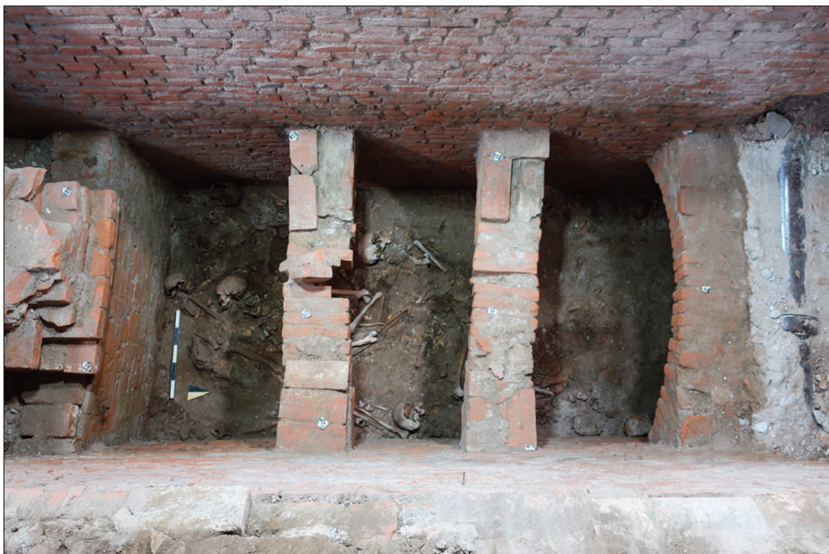
4. COMPLESSO DELL'EX CONVENTO DI SAN NICOLAIO A LUCCA: LA CAMERA EST, VISTA ZENITALE