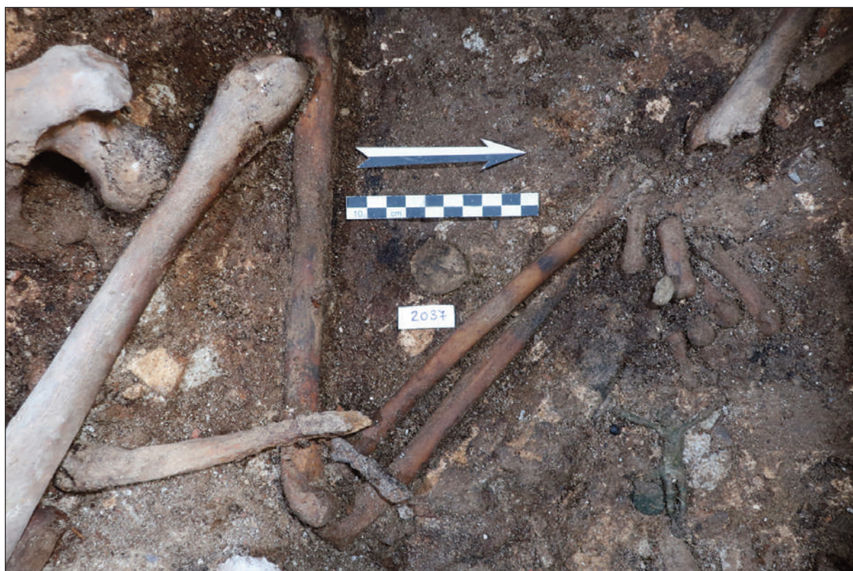
7. COMPLESSO DELL'EX CONVENTO DI SAN NICOLAO A LUCCA: DETTAGLIO DEL CORREDO DEVOZIONALE