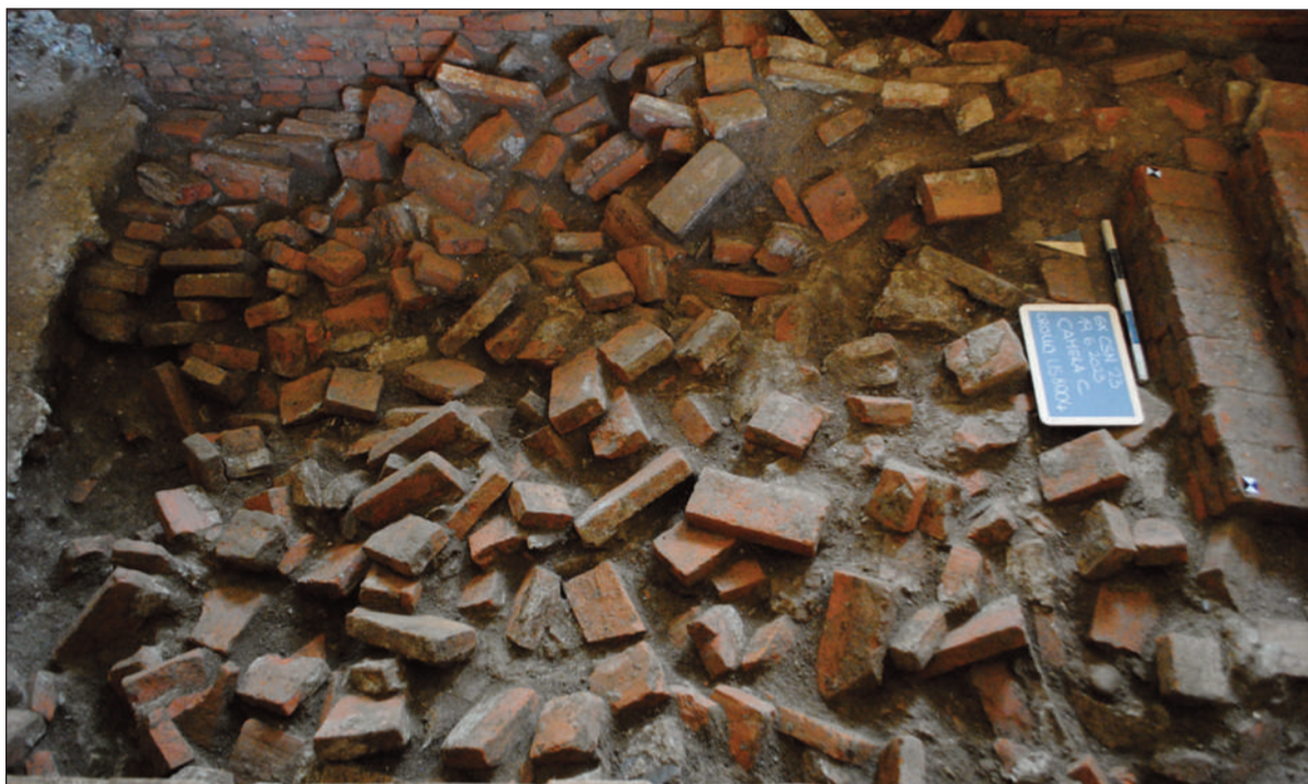
3. COMPLESSO DELL'EX CONVENTO DI SAN NICOLAO A LUCCA. PARTICOLARE DEL CROLLO DELLA VOLTA DELLA CAMERA CENTRALE