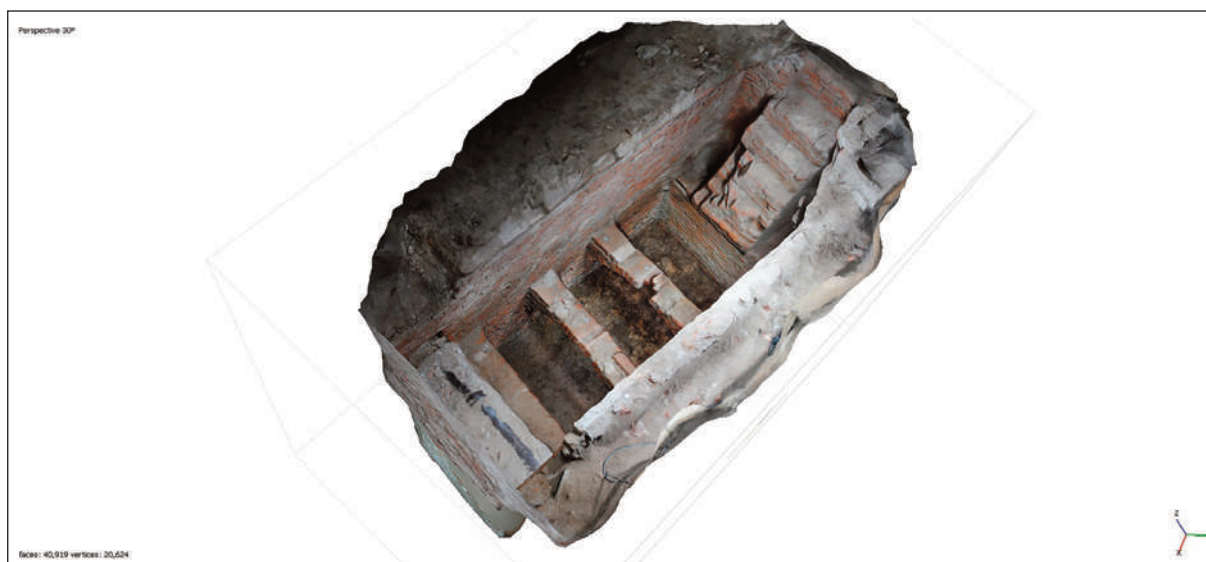
11. COMPLESSO DELL'EX CONVENTO DI SAN NICOLAO A LUCCA: FOTOGRAMMETRIA IN FASE DI ELABORAZIONE

Il metodo adottato ha permesso di contenere il grado di frammentarietà del campione, soprattutto per gli individui in accatastamento con dislocazione di alcuni elementi anatomici nei livelli inferiori, consentendo un'importante operazione di refitting meccanico e anatomico. La raccolta dei dati in situ , necessaria alla compilazione della scheda da campo, è stata corredata dalla documentazione fotografica e dal rilievo fotogrammetrico 7 , eseguito per ogni livello (fig. 11).