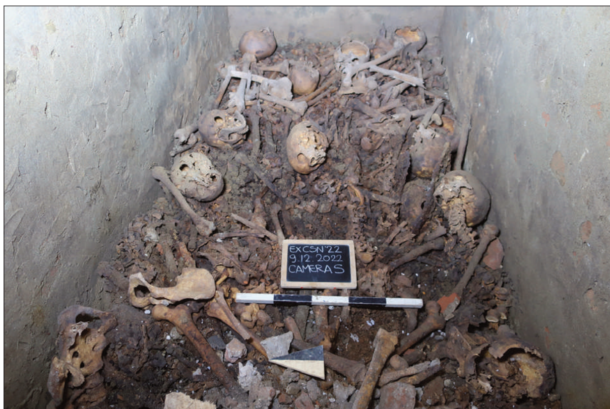
9. COMPLESSO DELL'EX CONVENTO DI SAN NICOLAO A LUCCA: SEPOLTURE IN ACCATAMENTO ALL'INTERNO DELLA CAMERA SUD