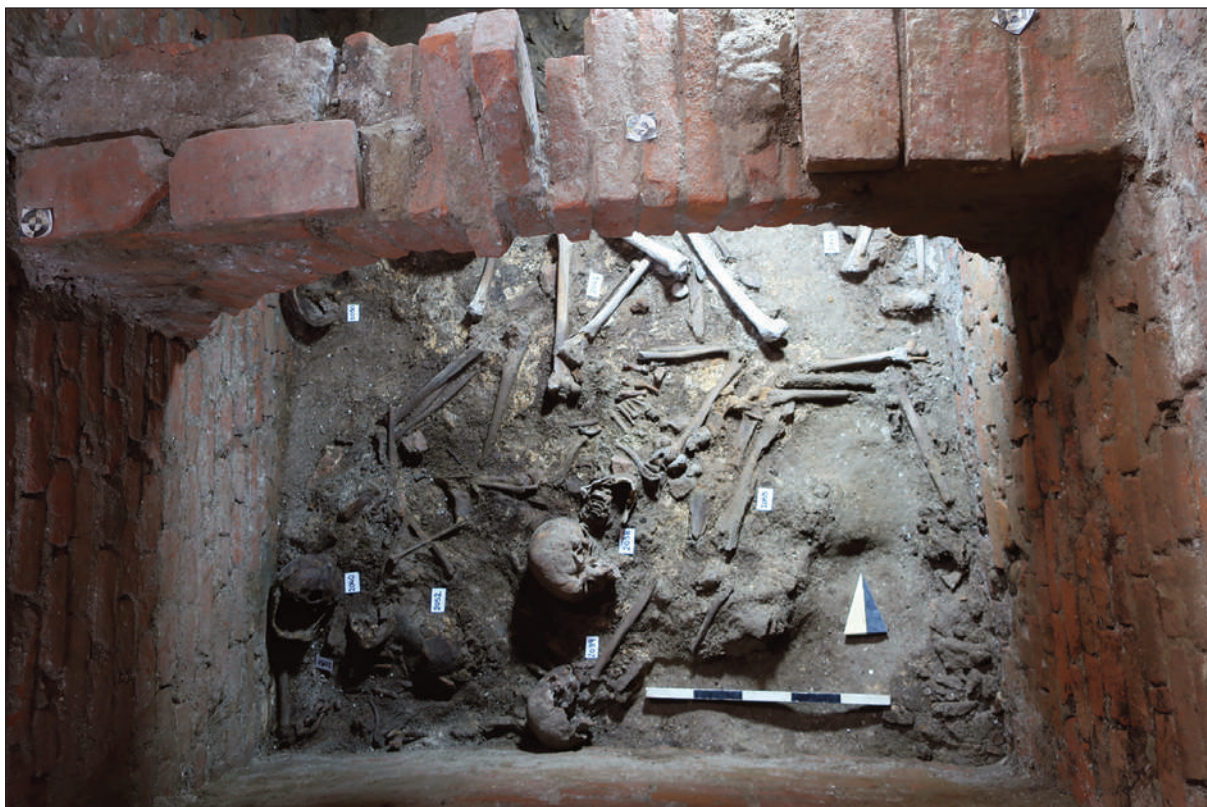
8. COMPLESSO DELL'EX CONVENTO DI SAN NICOLAO A LUCCA: GLI INDIVIDUI PARZIALMENTE RIDOTTI ALL'INTERNO DELLA CAMERA EST