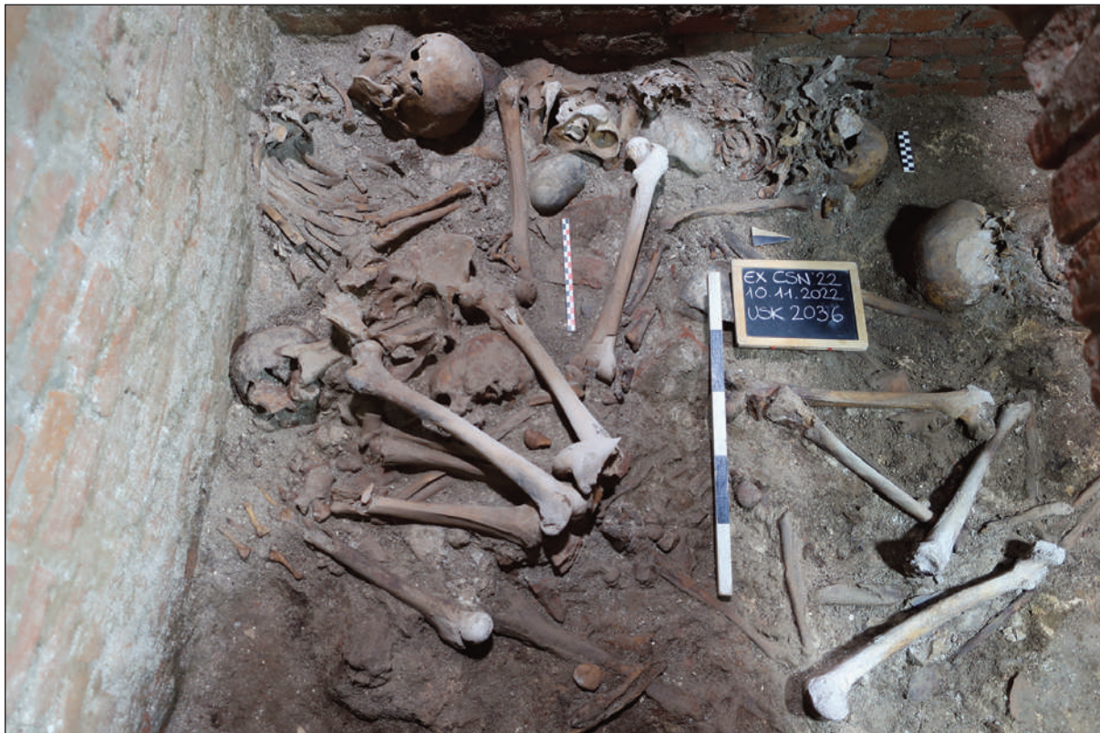
4. COMPLESSO DELL'EX CONVENTO DI SAN NICOLAIO A LUCCA: LE SEPOLTURE PIÙ RECENTI DEPOSTE ALLA BASE DELLA SCALA DI ACCESSO ALLA CAMERA EST