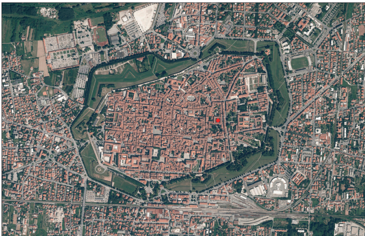
1. LUCCA, ORTOFOTO. SCALA 1:10000. POSIZIONAMENTO COMPLESSO EX CONVENTO DI SAN NICOLAO

Le monache, ritornate a occupare l'immobile nel 1853, lo abbandonarono definitivamente nel 1886. Da allora fino al 1923 il complesso fu adibito a uso scolastico come Regia Scuola Normale Femminile, mantenendo quindi a lungo una funzione educativa al femminile. Dal 1923 il complesso ha ospitato l'Istituto Magistrale Luisa Amalia Paladini, che ancora oggi ha in questo luogo la propria sede come Liceo di Scienze Umane insieme ad altri istituti scolastici.