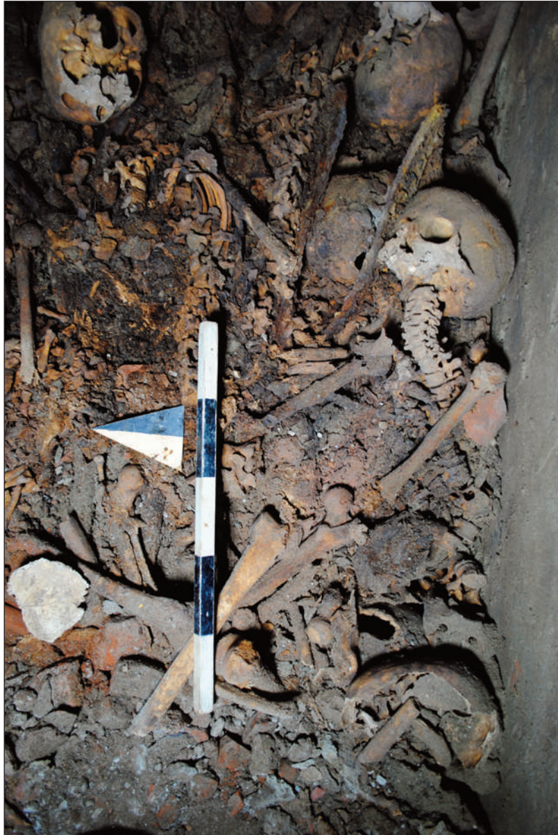
10. COMPLESSO DELL'EX CONVENTO DI SAN NICOLA O A LUCCA: PARTICOLARE DI UNA SEPOLTURA IN CONNESSIONE ANATOMICA ALL'INTERNO DELLA CAMERA SUD

Al fine di scongiurare la perdita di informazioni generata dal precario stato di conservazione dei reperti, è stata quindi implementata la fase di raccolta dati in situ , procedura che ha permesso un primo inquadramento dei fenomeni deposizionali e tafonomici. I risultati di seguito esposti rappresentano pertanto lo stato dell'arte, mentre il cantiere di scavo è ancora in corso sulle ultime due camere sepolcrali. Essi sono da intendersi preliminari, in attesa del completamento dell'indagine e del futuro studio in laboratorio; la loro presentazione vuole qui rendere conto della potenzialità del sito e dell'esito positivo che il metodo sta restituendo.