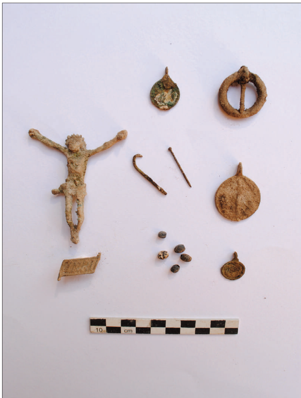
12. COMPLESSO DELL'EX CONVENTO DI SAN NICOLAO A LUCCA: DETTAGLIO DEL CORREDO DEVOZIONALE, FOTO SUL CAMPO (foto SABAP-LU)