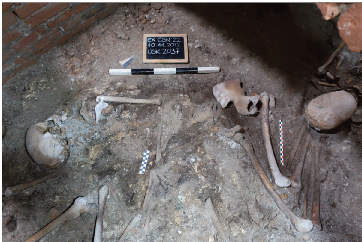
6. COMPLESSO DELL'EX CONVENTO DI SAN NICOLAO A LUCCA: L'INUMATO SEPOLTO IN POSIZIONE CENTRALE ALL'INTERNO DELLA CAMERA EST (foto SABAP-LU)